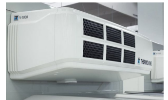
Bild: Thermo King V-1000